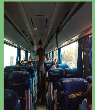
NUEVAMENTE LOS ESTUDIANTES QUE VIAJAN A LA CIUDAD DE ZACATECAS SE VIERON BENEFICIADOS CON UN TRANSPORTE PARA SU TRASLADO, ELLO POR GESTIÓN DEL INSTITUTO DE LA JUVENTUD ANTE PRESIDENCIA MUNICIPAL