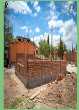
INICIA LA OBRA DE CONSTRUCCIÓN DE 1 AULA EN LA ESCUELA PRIMARIA "MIGUEL AUZA" UBICADA EN LA COL. LOS PUENTES DE LA CABECERA MUNICIPAL