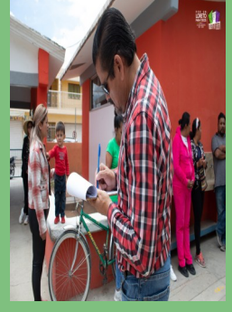
REHABILITACIÓN DE SANITARIOS EN LA ESCUELA PRIMARIA "MANUEL RANGEL MARTÍNEZ" EN LA CABECERA MUNICIPAL