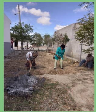
EL PRESIDENTE MUNICIPAL ASÍ COMO LOS DIRECTORES DE LOS DEPARTAMENTOS APOYARON AL GRUPO DE LA TERCERA EDAD DE COL. EMILIO CARRANZA CON UN HUERTO DE HORTALIZAS.